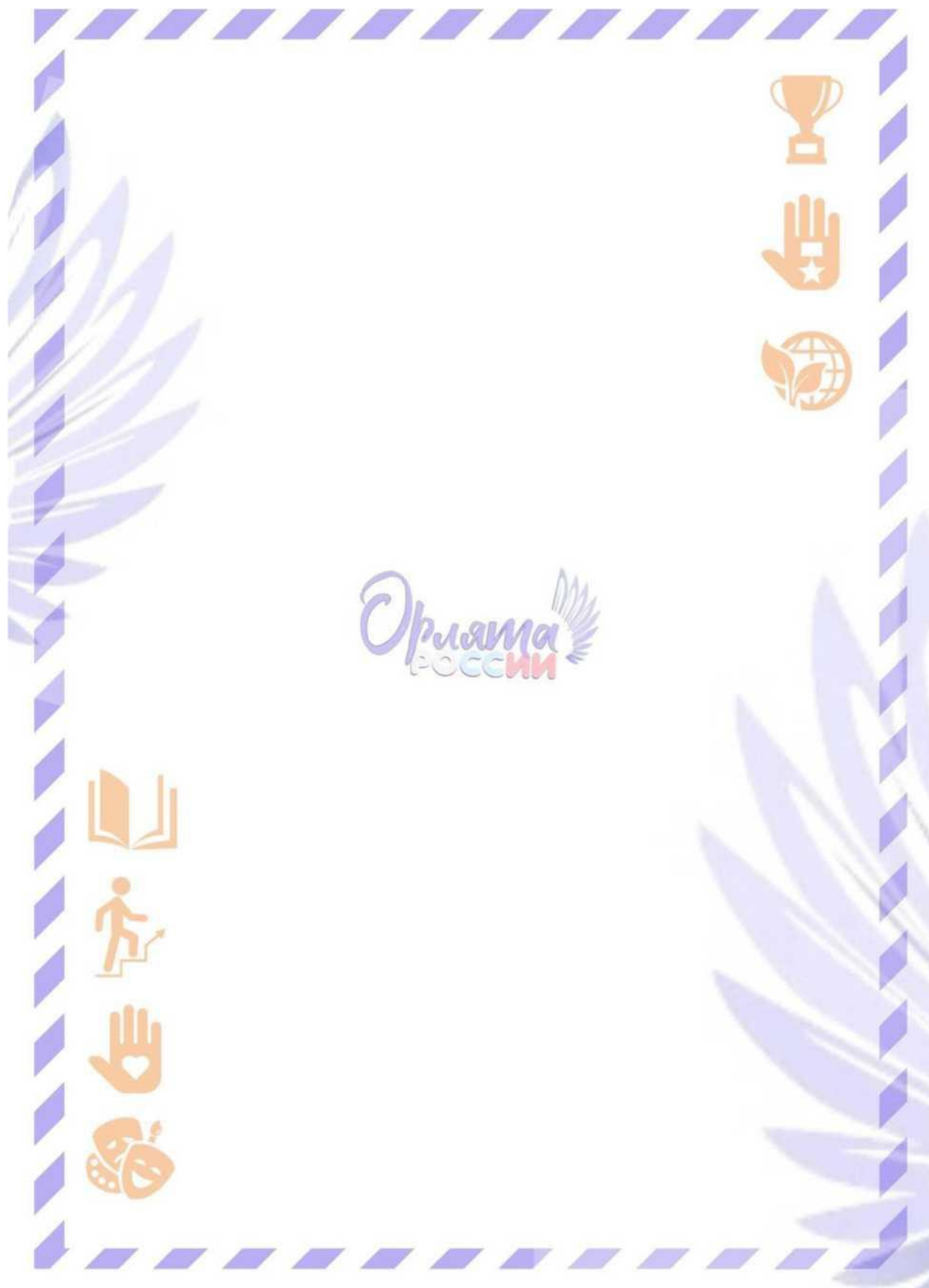
Рис. 2. Обратная сторона «Письма в Будущее»